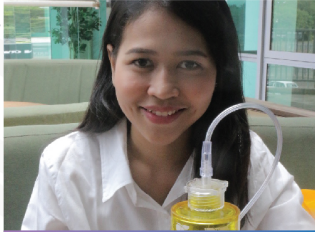
Rode Untari Tangerang

"Saya sekeluarga rutin inhalasi Hydro-Gen Fontaine PEM & Inhaler setelah dinyatakan ODP Covid-19. Hasilnya, 2 kali rapid test dinyatakan negatif. Gejala asma pun tidak pernah kambuh."